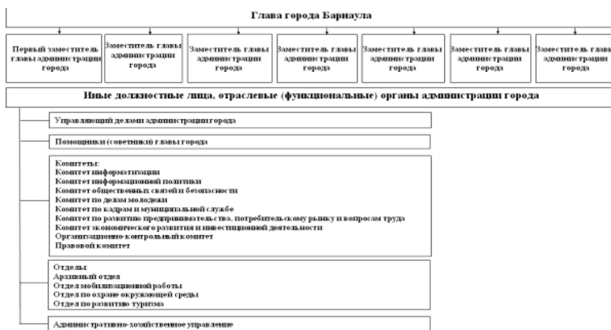
Рисунок 1 – Структура администрации г. Барнаула

Структура администрации г. Барнаула утверждается Барнаульской городской Думой по представлению главы администрации города. Действующая структура администрации города Барнаула утверждена решением Барнаульской городской Думы от 3 июня 2011 года № 548 [7] и представлена на рис.1 [9].